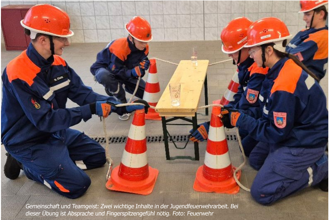
Gemeinschaft und Teamgeist: Zwei wichtige Inhalte in der Jugendfeuerwehrarbeit. Bei dieser Übung ist Absprache und Fingerspitzengefühl nötig.

Kirchehrenbach Prüfungen, Wettkämpfe und das Miteinander stärken: Die Jugendfeuerwehr hat im abgelaufenen Jahr eine enorme Palette an Aktivitäten absolviert. Neben den üblichen Prüfungen und Wettkämpfen war der 24-stündige Berufsfeuerwehrtag sicherlich der Höhepunkt. Bei der Jahreshauptversammlung des Feuerwehrynachwuchses wurde zurückgeblückt.